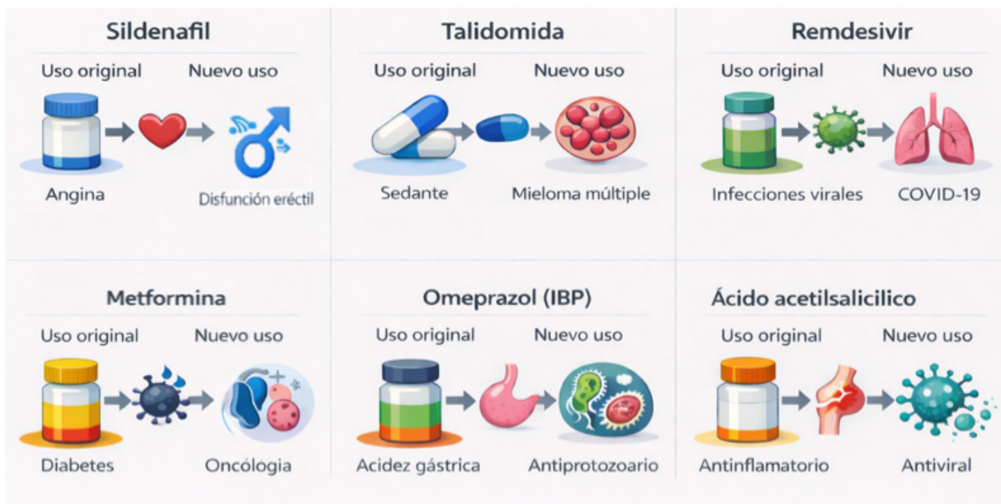
Figura 2. Casos representativos de reposicionamiento farmacológico. Ejemplos de medicamentos que, tras ser desarrollados para una indicación original, encontraron nuevas aplicaciones terapéuticas en áreas distintas. Imagen Elaborada con ChatGPT 5.1.

Otras historias provienen de medicamentos de uso cotidiano cuyo alcance rara vez se cuestiona. Los inhibidores de la bomba de protones , como el omeprazol, conocido por